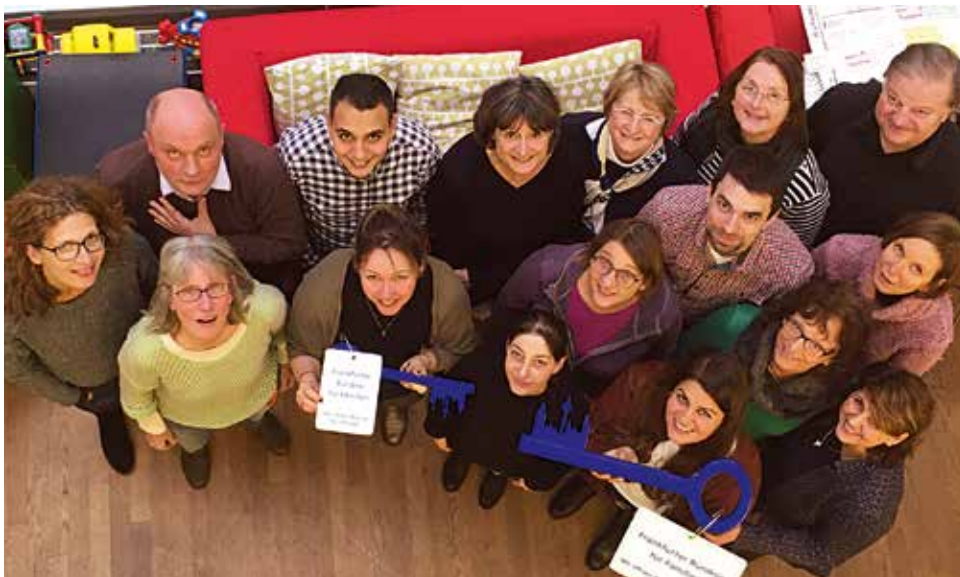
Ein starkes Bündnis für Familien – AG Auskommen mit dem Einkommen